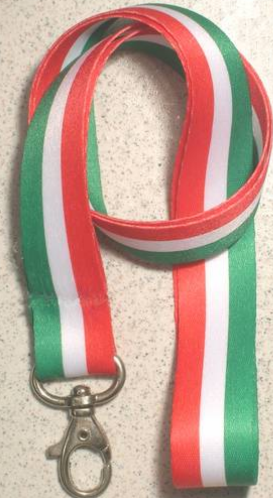
E6956000 (lunghezza nastro cm 43)