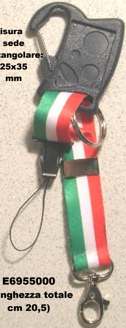
E6955000 (lunghezza totale cm 20,5)